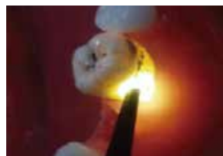
歯石確認・クラウンマージ部