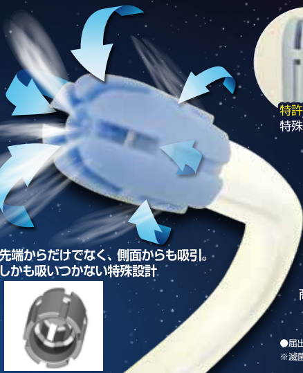
先端からだけでなく、側面からも吸引。 しかも吸いつかない特殊設計