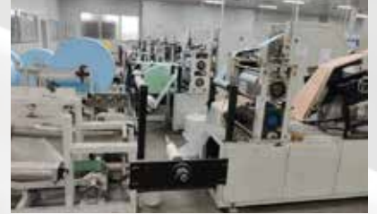
BSA向けに月間3万箱のエプロンの製造を行っています。