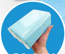
100枚ずつパックされているので保管に便利

●1箱500枚入り(100枚×5) ●サイズ: 455×330mm ●立体ギャザ付2層●片面防水