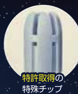
特許取得の特特殊チップ

01 強い吸引力が得られながら、口腔粘膜の吸着を最小限に抑えた特殊形状チップ。他にはない快適な使い良さ。