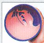
アルギノプラストEM

アルギノプラストEMは、マイクロファイン粒子による粉末で水がより速やかに混合する、イージーミックスを実現しました。またダストフリータイプで粉末の飛散がほとんどありません。