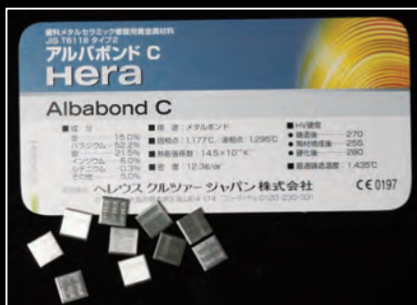
製品コード:00177(包装単位:10g)