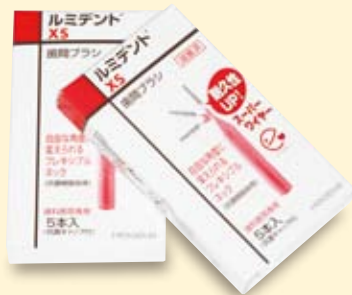
■ 製品コード X0307 ルミデント XS (5本×10箱)