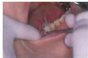
硬化後コアフォームを除去し、支台歯形成をおこなう。