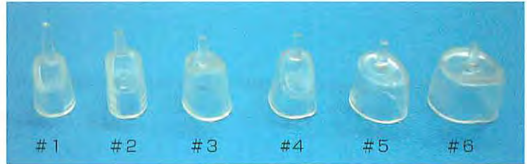
ウレタン素材 (ポリエーテル カーボン ウレタン)