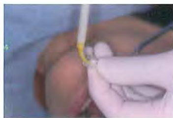
ビルドイット FRを気泡を巻き込まないように注入し、付属のハンドルを用いて口腔内にセット