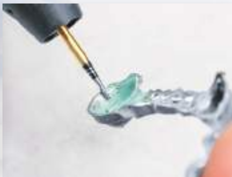
H73SHAX-014 クラウンの内面修正