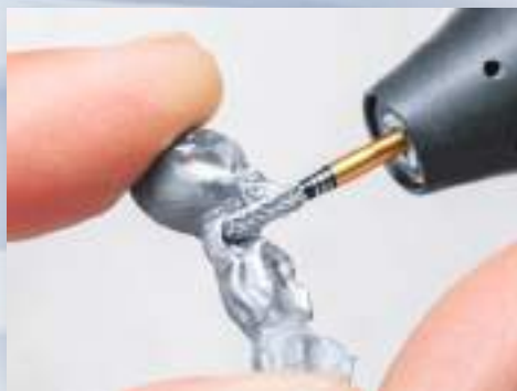
H129SHAX-023 クラウンブリッジの形態修正

ブレード一枚一枚の幅や深さに変化を与えたIntelligent Combination Design。これによりSHAXカッターは 従来品より高い切削力と高い耐久性を実現しました。