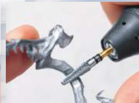
H79SHAX-040 金属床の形態修正