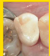
仮封後(ガラスアイ オノマーセメント)。