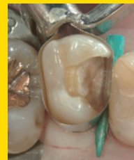
覆髄後。 マトリクス装着。