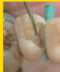
ライナーアプリーケーターによる覆髄。 適量のセラカルLCで的確なスポット覆髄が可能。