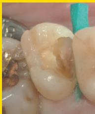
う蝕除去後。 不顕性露髄。