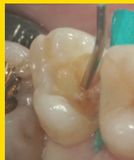
セラカルLC シリンジチップによる 覆髄。