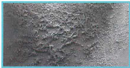
④エタノール含有クリーナーに浸漬させたレジン表面