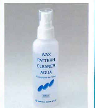
ワックスパターン表面処理材 (ポンプ式スプレータイプ)

铸造体の気泡発生、面荒れを防ぎ、滑沢な铸造面が得られます。エタノールを含有していないため、歯科用パターンレジンにも安心して使用できます。