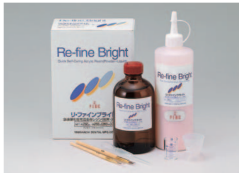
1-1セット/粉末250g & 液材260ml