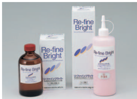
単品/粉末250g & 液材260ml