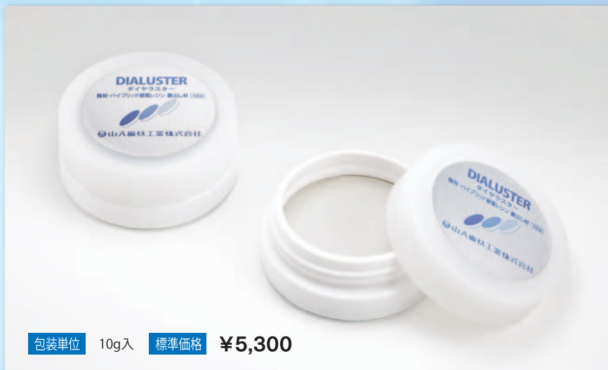
包装単位 10g入 標準価格 ¥5,300