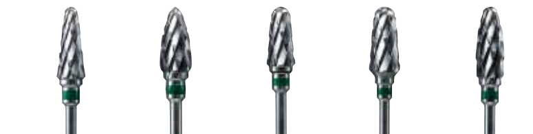
規格 C-1 C-2 C-3 C-4 C-5 写真は原寸です。