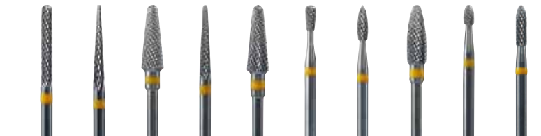
規格 SF-1 SF-2 SF-3 SF-4 SF-5 SF-6 SF-7 SF-8 SF-9 SF-10 写真は原寸です。