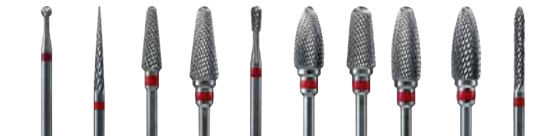
規格 F-1 F-2 F-3 F-4 F-5 F-6 F-7 F-8 F-9 F-10 写真は原寸です。