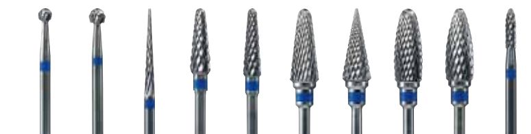
規格 M-1 M-2 M-3 M-4 M-5 M-6 M-7 M-8 M-9 M-10 写真は原寸です。