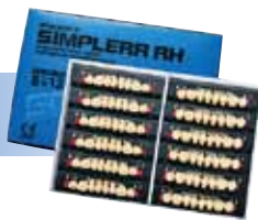
エフセラ-P シンプレー RH