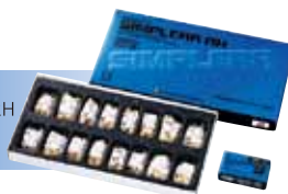
エフセラ-P シンプレー RH ピースフォーム