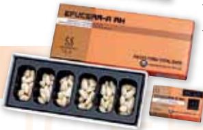
エフセラ-A RH ピースフォーム