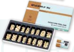
エフセラ-P RH ピースフォーム