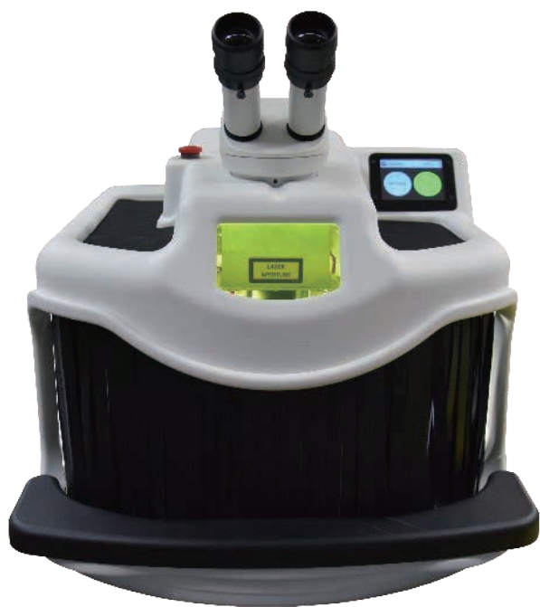
- 前面 -