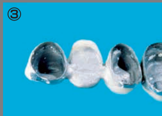
パラジウム系レーザーワイヤー使用