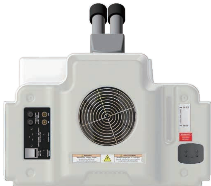
- 背面 -