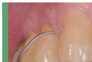
タイトな歯肉溝にも負担なく挿入。