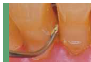
狭い歯間部にも容易に挿入。