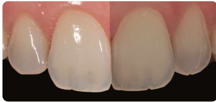
スマイルライト 偏光フィルター なし

Smile Lite 偏光フィルターはスマイルライトのセットとして同梱されています。フィルターはスマイルライトにマグネットで簡単に着脱できます。