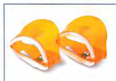
IC付ライトガイド(2個セット)