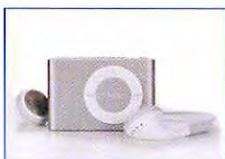
ガイダンスシステム