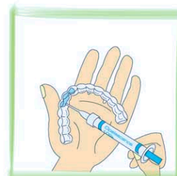
ホワイトニングジェルを注入