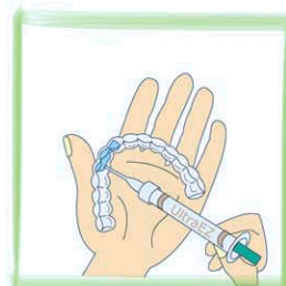
ウルトライーズを注入