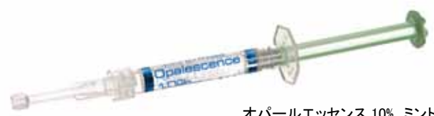
オパールエッセンス 10% ミント