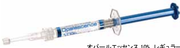
オパールエッセンス 10% レギュラー