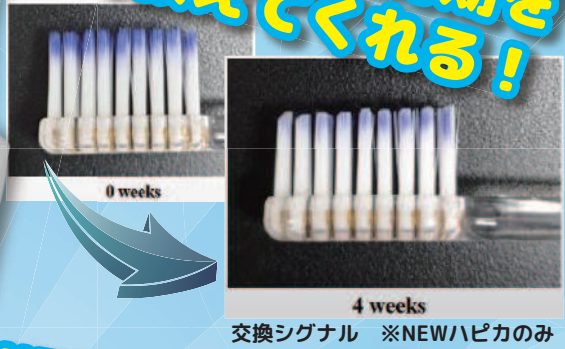
交換シグナル ※NEWハピカのみ