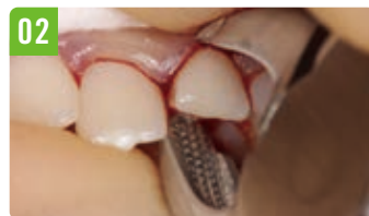
02 回転力を加えても滑らない