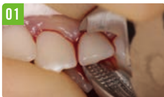
01 しっかりと歯冠を把持