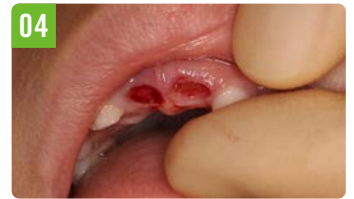
04 最小限のダメージ