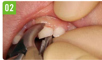
02 正確に歯冠を把持