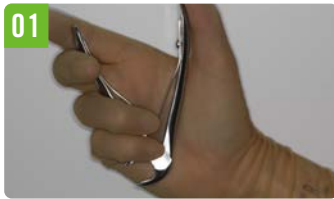
01 手のひらに隠れる大きさ (私の手はかなり小さい方です)

既存の乳歯フォーセップスと違い先端形状が工夫され、歯肉へのダメージを最小限にする事ができます。また、手のひらに隠れる大きさのため子どもの視野に入りにくいのも特徴です。