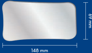
ウインドライトミラー咬合面用 厚さ1mm