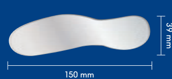
ウインドライトミラー頬側用 厚さ1mm