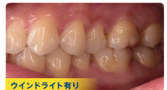
ウインドライト有り