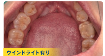
ウインドライト有り