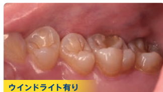
ウインドライト有り