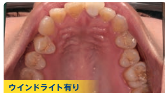
ウインドライト有り