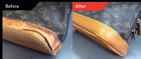
ルイヴィトン バッグ (底部分のリペア) ¥20,000~