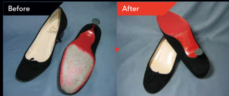
レディスパンプス ハーフラバーソール(半張り) ¥2,200~