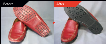
TOD'S ドライビングシューズ (オールソール交換) ¥12,000~