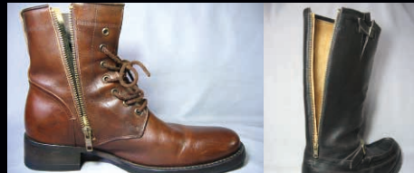
ブーツ (ファスナー取付) ¥10,000~