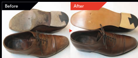
紳士靴オールソール(革)ダウ型ヒール ¥14,000~

日本全国からネットを通じてリペア、リフォームの御依頼を頂いております。他店で修理を断られた靴やカバンでも何なりとご相談ください! 修理メンテナンスだけでなく、ブーツ丈カット・筒口の縮小・拡大などのお好みに合わせた改造・カスタムのご相談も承ります。