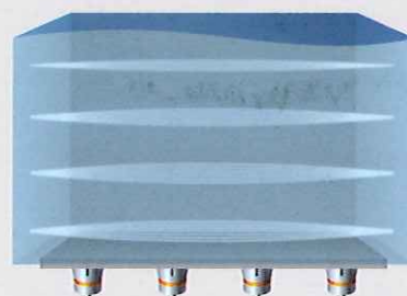
平面波による超音波洗浄方式