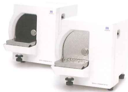
本製品はRoHS指令6物質の含有基準及びREACH規則に適合しています。

一般的名称: 歯科技工用トリマ 販売名: ダイヤトリマーMT10D 機器の分類: 一般医療機器(クラスI) 医療機器届出番号: 11B2X00071000036 標準価格: 153,000円 103216